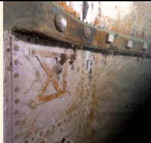
Aktuelle Forschungen: HMS Investigator 65