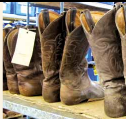
Echte Cowboystiefel aus Calgary 58