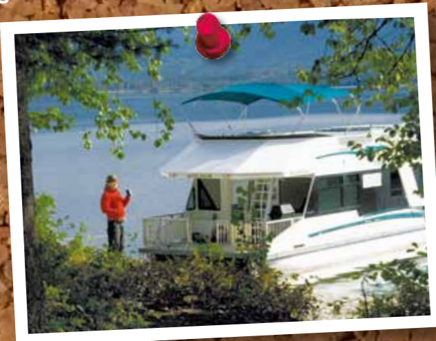
Jacuzzi Ahoi! Hausboottour auf den Shuswap Lake 8