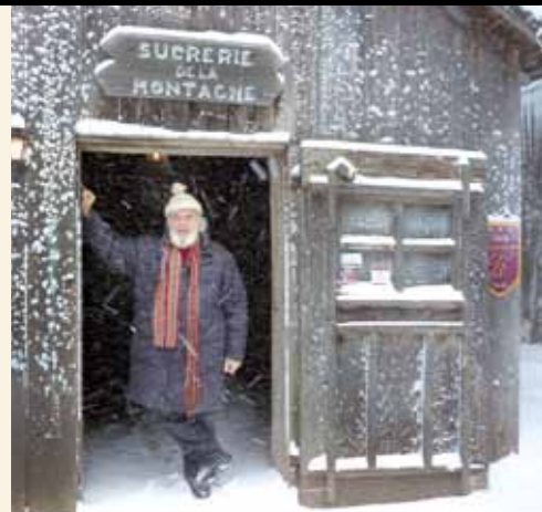
Maple Syrup-Farm wie anno dazumal 62