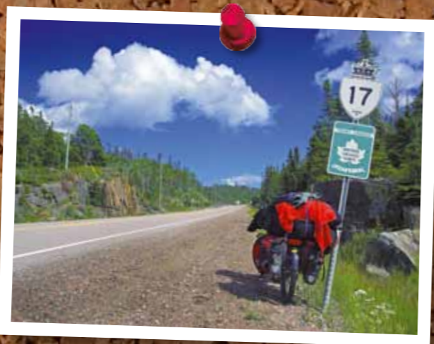
Mit dem Rad durch Kanada 24