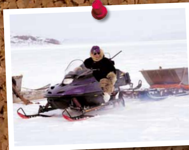
Welt der Inuit – Nunavut 50