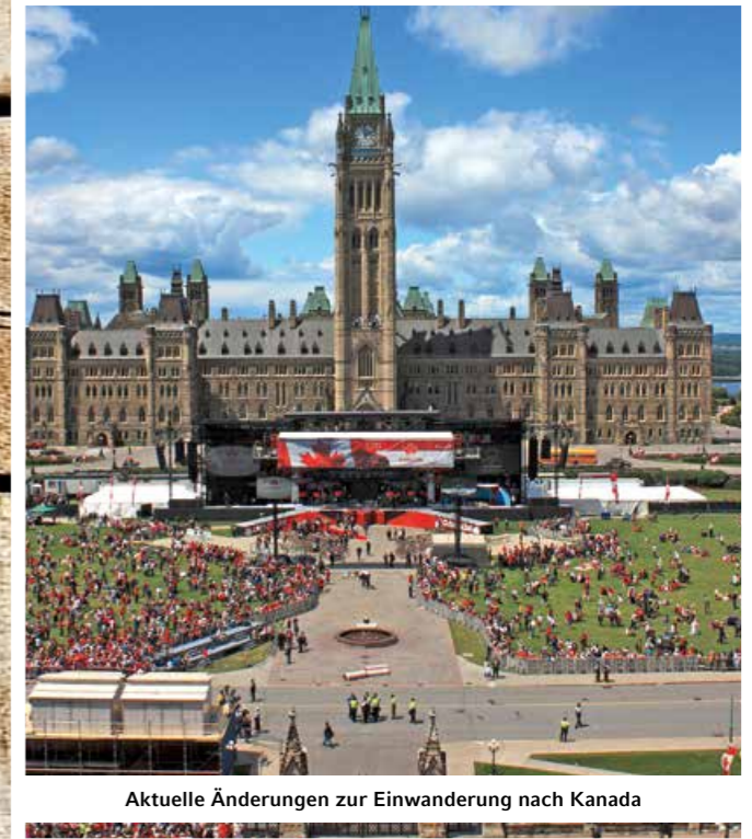
Aktuelle Änderungen zur Einwanderung nach Kanada

64 Einwandern nach Kanada: der aktuelle Stand Im Jahr 2012 und Anfang 2013 änderten sich eine ganze Reihe wichtiger Faktoren in den verschiedensten Kategorien des kanadischen Einwanderungssystems. Einige davon traten zum Jahreswechsel in Kraft, während andere erst im Laufe des Jahres 2013 Gesetzeskraft erlangen werden. Helmut Daiminger fasst die Änderungen zusammen.