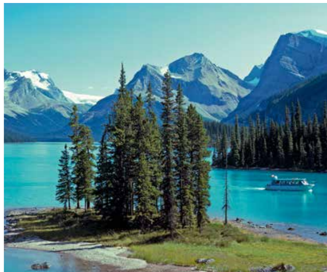
Berühmtes Fotomotiv: Maligne Lake mit Spirits Island