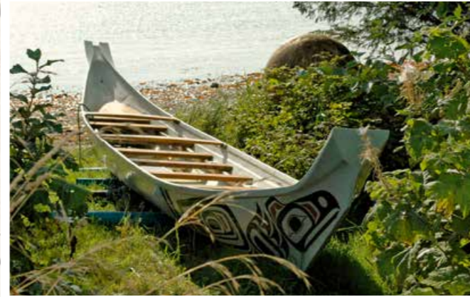
Bemaltes Kanu auf Haida Gwaii

20 Ganz im Westen: Geschichte, traditionelle Kunst und kulturelle Wiedergeburt auf Haida Gwaii Wer sich mit Haida Gwaii beschäftigt, wird immer wieder auf die enge Verknüpfung von Natur, Geschichte und Kunst der Haida stoßen, was auch den ganz besonderen Reiz dieser Inselgruppe am westlichen Rand von Kanada ausmacht. Ein Bericht von Wolfgang Opel .