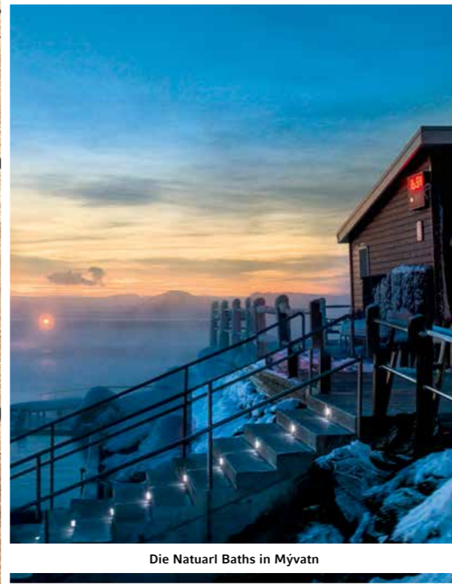
Die Natuarl Baths in Mývatn

48 Eis trifft Feuer Im Sommer locken farbenprächtige Natur und Whale-watching. Im Winter bilden Islands heiße Quellen und dampfende Fumarolen mit der Schneelandschaft einen starken Kontrast. Geraldine Friedrich hat einen Zwischenstopp in Island gemacht.