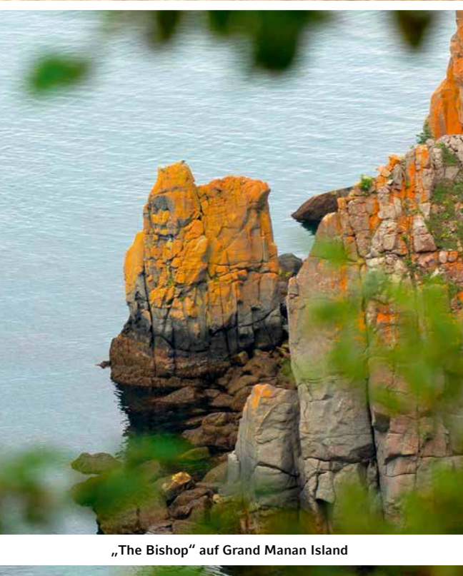
„The Bishop“ auf Grand Manan Island

Die schöne Insel Grand Manan in der Bay of Fundy, etwa 34 Kilometer lang und maximal 18 Kilometer breit, ist mit knapp 2500 Einwohnern eher dünn besiedelt. Mit spektakulären steilen Klippen vor allem im Norden und Westen der Insel bietet sie mannigfaltige Möglichkeiten für Wanderungen, von denen Mechtild Opel einige ausprobieren möchte.