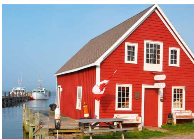
Nova Scotia: Bay of Fundy und Brier Island

Auf dem Weg zu einer erneuten Walbeobachtungstour erlebt Mechtild Opel , dass die Bay of Fundy ihren Spitznamen „Bay of Fog“ (Nebelbucht) gelegentlich zu Recht trägt – was soll da aus der geplanten Bootstour werden?