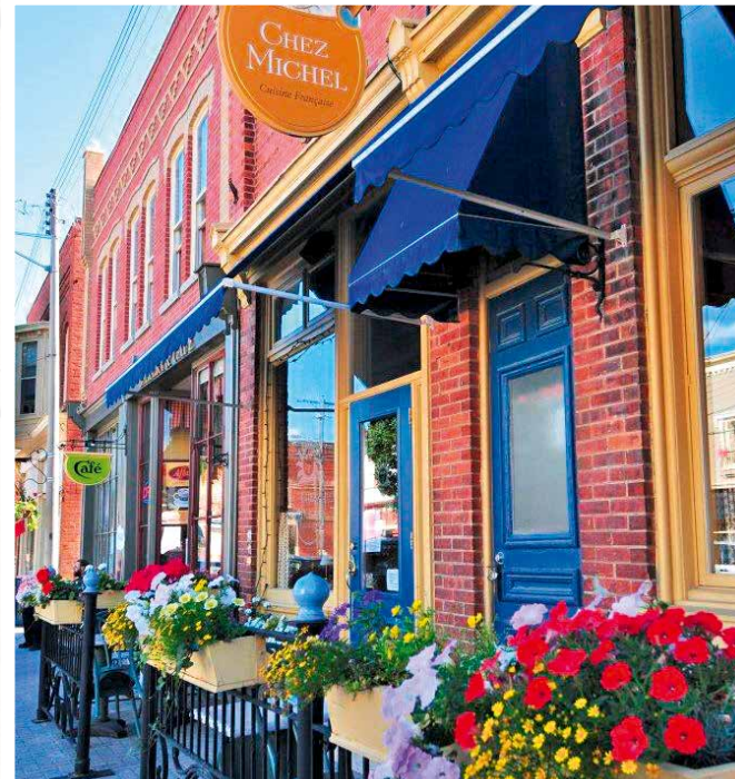
Ontario: malerisches Städtchen in den Blue Mountains