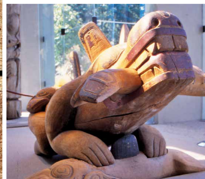
Vancouver: Museum of Anthropology

Museen eilt der Ruf voraus angestaubte und langweilige Orte zu sein. Deshalb wählt der unternehmungs-